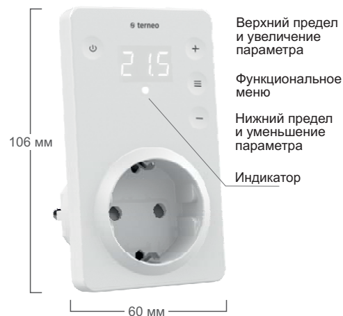
Рисунок 1. Габаритные размеры terneo srz

Для защиты от короткого замыкания в цепи нагрузки, обязательно необходимо перед терморегулятором