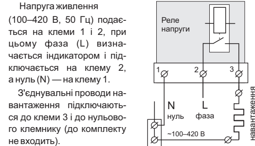
Схема 1. Спрощена внутрішня схема та схема підключення

З'єднання навантаження з мережним нулем в клемі 1 НЕ ЗДІЙСНЮВАТИ!